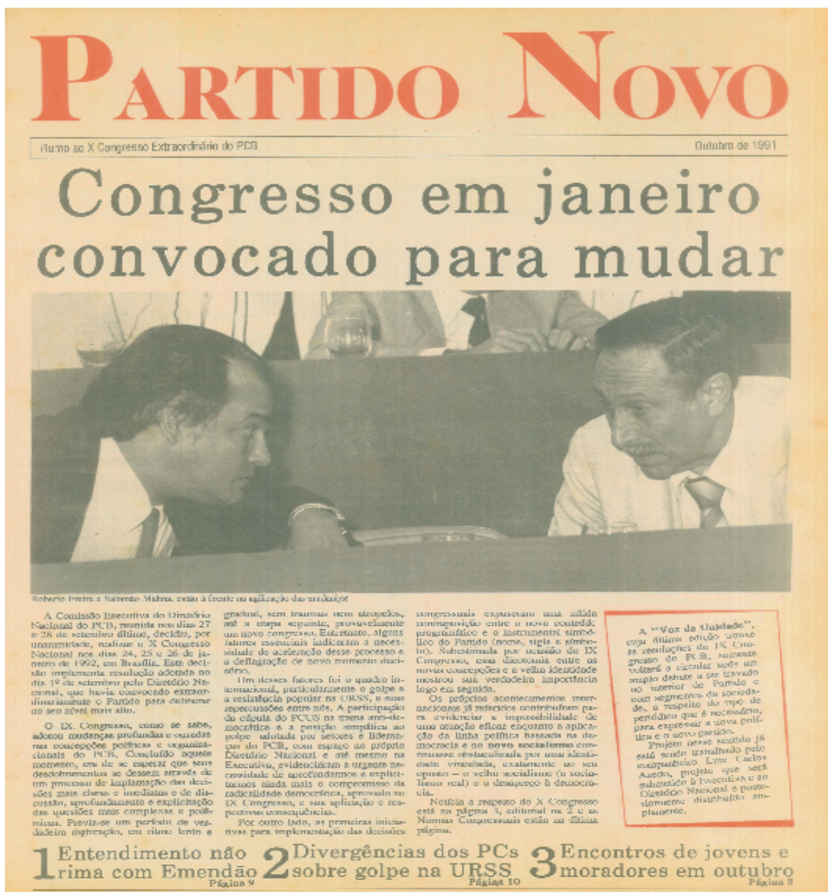
Figura 9 – Primeira página do fascículo de outubro de 1991 (VOZ DA UNIDADE já com o seu título transmutado para Partido Novo)

O jornal esclarece que no 9º Congresso foram adotadas “mudanças profundas e ousadas nas concepções políticas e organizacionais do PCB”, e que para continuar seria necessário romper com o “velho socialismo [...] e o desapareço à democracia” (primeira página acima). Nesses enunciados há um deslizamento de sentido em relação à renovação, ou seja, para se tornar em um novo partido o PCB deveria romper com os preceitos e fundamentos que deram origem à “vanguarda consciente dos trabalhadores”, e que já nesse momento o que era vanguarda havia se tornado em “velho socialismo”.