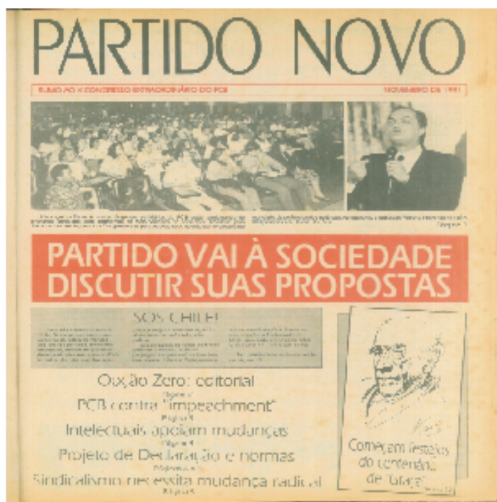
Figura 10 – Primeira página do fascículo de novembro de 1991

O PCB afirma que “vai à sociedade discutir suas propostas”. E, procurando engajar-se nos temas nacionais e internacionais, publica notícias da política brasileira e do exterior. Mas o que irá ocupar a maior parte de suas páginas é justamente o assunto que estava na agenda do dia do Partido: a sua renovação. A busca por um novo nome, um novo símbolo e uma nova sigla demonstrava um desejo de total rompimento do Partido com a dogmatização do pensamento marxista. O que os renovadores