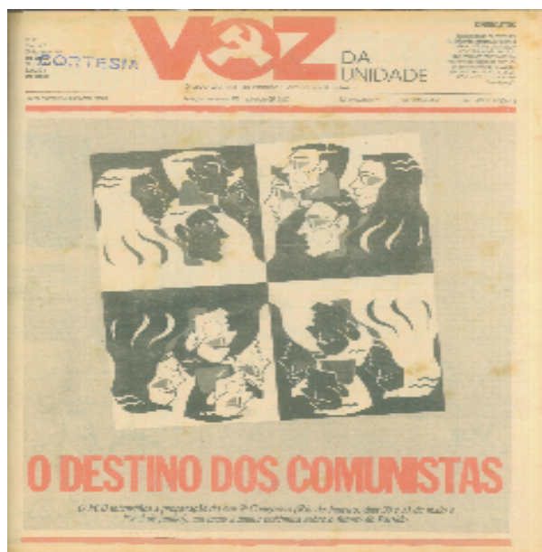
Figura 4 – Primeira página do fascículo de 01 de março de 1991

“O destino dos comunistas” é o título que abre a manchete de março. Abaixo deste enunciado, o jornal explica que o PCB está intensificando a “preparação de seu 9º Congresso [...] em meio à maior polêmica sobre o futuro do Partido”. A esta edição somou-se o Caderno Tribuna de Debates, encarte que acompanhou todos os fascículos de 1991 até a realização do evento, e que reuniu questões sobre a nova face do PCB, assunto que seria a tônica para o debate no Congresso.