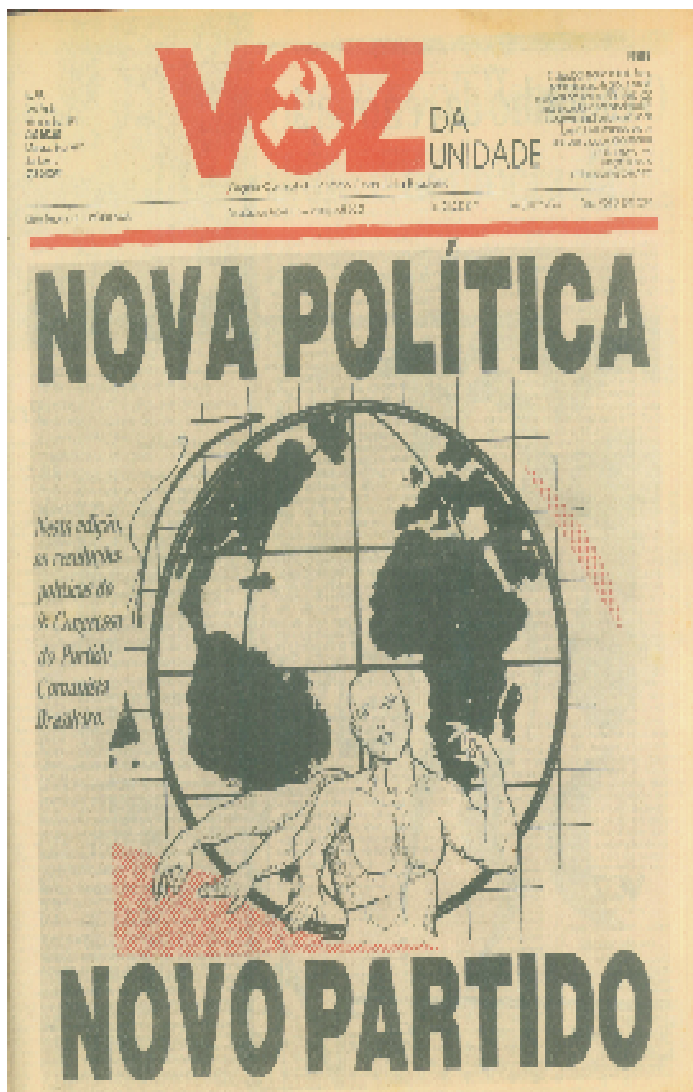
Figura 8 – Primeira página do fascículo de 15 de junho de 1991

Um mês após, no fascículo de 15 de junho, o 9º Congresso do PCB já havia acontecido, e as propostas de resoluções debatidas e aprovadas. Neste número, o VOZ publica em sua primeira página o título “NOVA POLÍTICA, NOVO PARTIDO”, e ao centro, um globo terrestre com uma figura humana numa posição de que estaria descerrando seus braços. O PCB vendo que o mundo acenava para um convívio mais pacífico e cooperativo entre as nações, e reconhecendo que arregimentar somente a classe operária para derrubar o Estado burguês já não bastaria para fazer a sua revolução, considerou que se manter fechado nas doutrinas de Marx e de Lênin não seria mais possível, devendo, a partir de então, aprender e aplicar o intercâmbio econômico, político e social entre países e partidos.