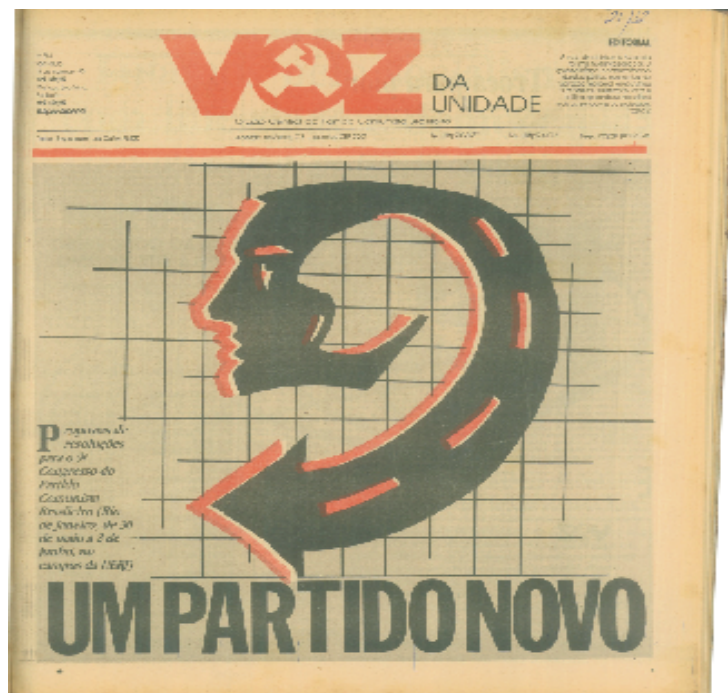
Figura 7 – Primeira página do fascículo de 15 de maio de 1991

Nas páginas centrais, sob o título “Nova política, partido novo”, o PCB apresenta nesta edição as principais questões que serão discutidas no evento, reconhecendo que os “os velhos critérios, parâmetros e princípios” estavam ruindo, trazendo à tona a necessidade de se pensar “novos caminhos e abrir novos horizontes” (p. 7). Nessa matéria o Partido apresenta um panorama da situação mundial, a sua posição e a do Brasil frente aos recentes