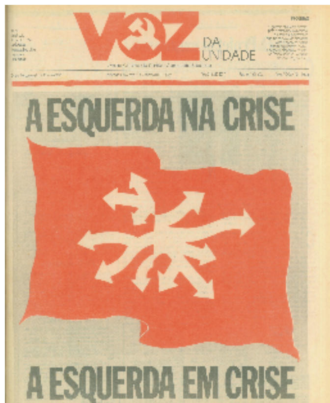
Figura 5 – Primeira página do fascículo de 01 de abril de 1991

A primeira página da edição de abril de 1991 traz uma multiplicidade de setas, inseridas na bandeira vermelha, que é desnorteante. As muitas direções em evidência tornam visíveis as incertezas e os questionamentos que assolavam o Partido naquele momento. A bandeira vermelha – emblema histórico da Revolução Russa – mostra que o PCB, estando ainda sob a égide de suas origens, não sabia ao certo qual rumo tomar. E como o sentido de um discurso está ligado às suas condições de produção, uma vez que este (sentido) é história, e não literal (ORLANDI, 2005, p. 95), a historicidade que emana desses enunciados – “A esquerda na crise, A