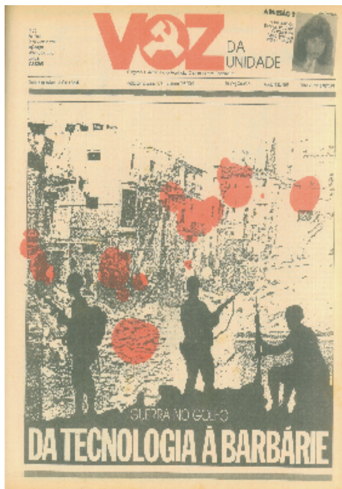
Figura 3 – Primeira página do fascículo de 01 de fevereiro de 1991