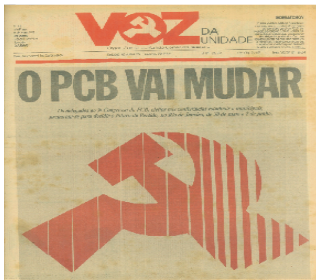
Figura 6 – Primeira página do fascículo de 01 de maio de 1991