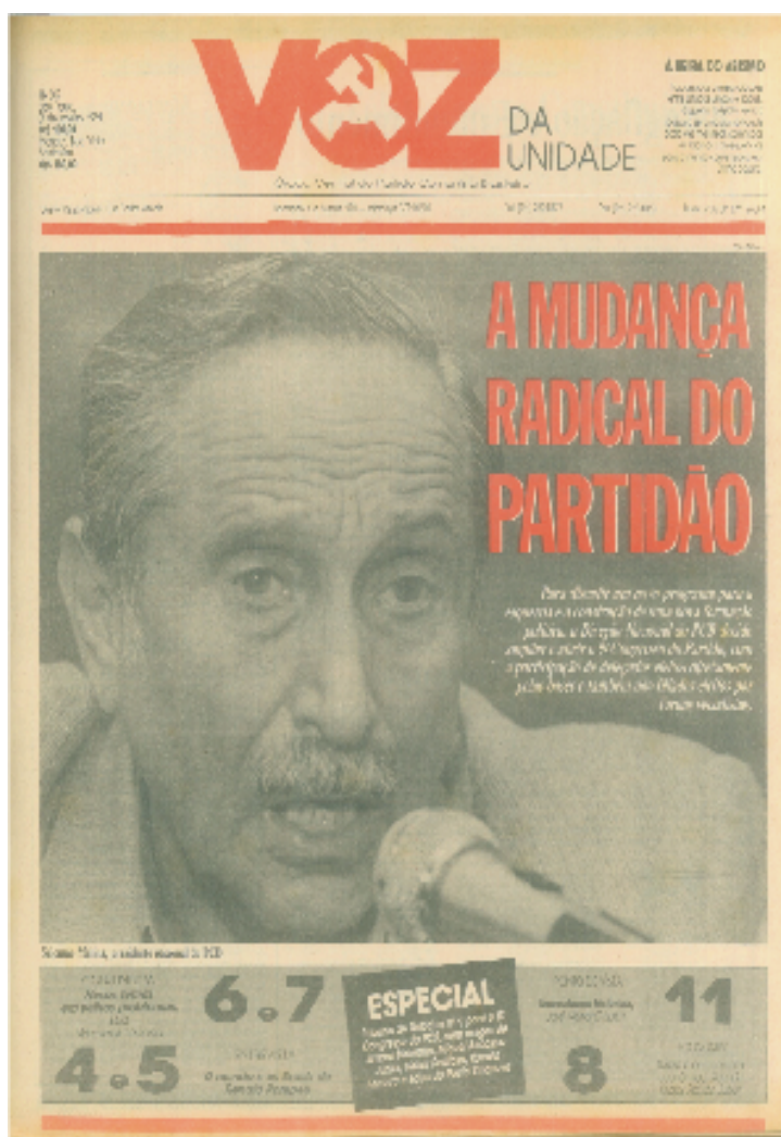
Figura 2 – Primeira página do fascículo de 01 de janeiro de 1991

Iniciando 1991, o jornal publica o primeiro fascículo do ano com a manchete em letras vermelhas declarando “A mudança radical do Partidão”. Essa mudança, segundo Roberto Freire, seria romper com dogmas, catecismos e verdades que desmoronam com o “primeiro sopro da realidade” ( VOZ DA UNIDADE , nº 508, p. 12, de 01 de dezembro de 1990), referindo-se à crise mundial que afetava a esquerda e as incertezas quanto aos rumos do socialismo real como forma eficiente de governo. O socialismo real, e que agora estava em colapso, foi aplicado na (ex)URSS e no Leste Europeu por décadas, e que, segundo os marxistas-leninistas, é a fase inicial em que são criadas as bases para se chegar à sociedade comunista, como, por exemplo, a