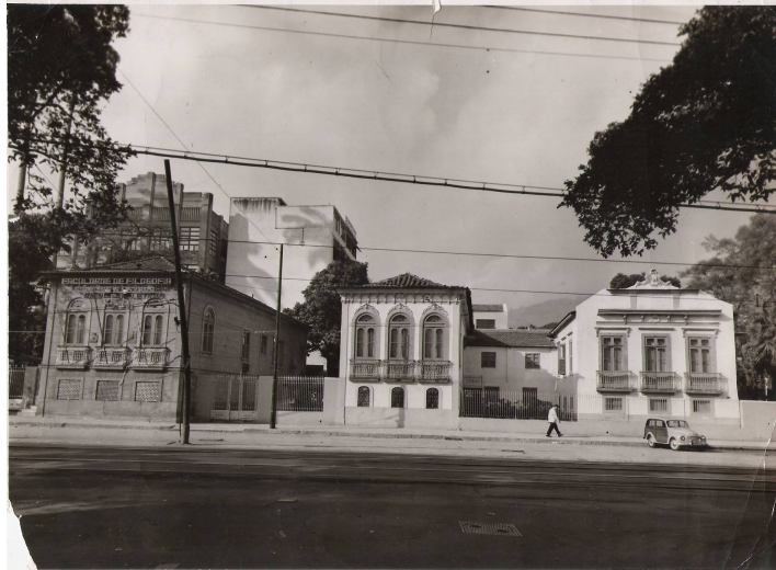
Foto 2- Expansão da Faculdade de Filosofia na Haddock Lobo: década de 1950.