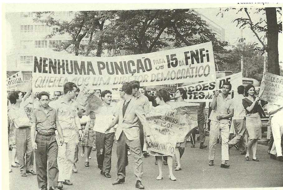
Fotografia 1: Passeata contra a suspensão

A suspensão foi motivo de grande protesto dos estudantes. A fotografia abaixo mostra uma delas.