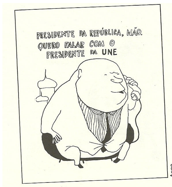
Figura 1: Charge Appe

A importância da UNE e do movimento estudantil, principalmente no governo João Goulart, fica clara com a análise da charge abaixo