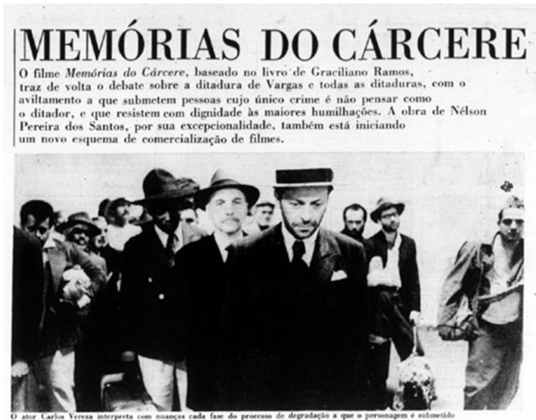
Jornal do Brasil – 18 de Junho de 1984.

O Jornal do Brasil revelaria que o filme “traz de volta o debate sobre a ditadura Vargas e todas as ditaduras, com o aviltamento a que submetem pessoas cujo único crime é não pensar como o ditador (...)”. Além disso, no caderno cinema, o mesmo jornal anunciava: “Entra hoje em cartaz Memórias do Cárcere , de Nelson Pereira dos Santos que recebeu o Prêmio da Crítica do Festival Internacional de Cannes”.