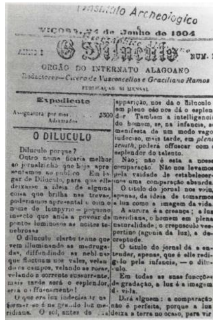
Primeira página de O dilúculo, de 24 de junho de 1904. 44