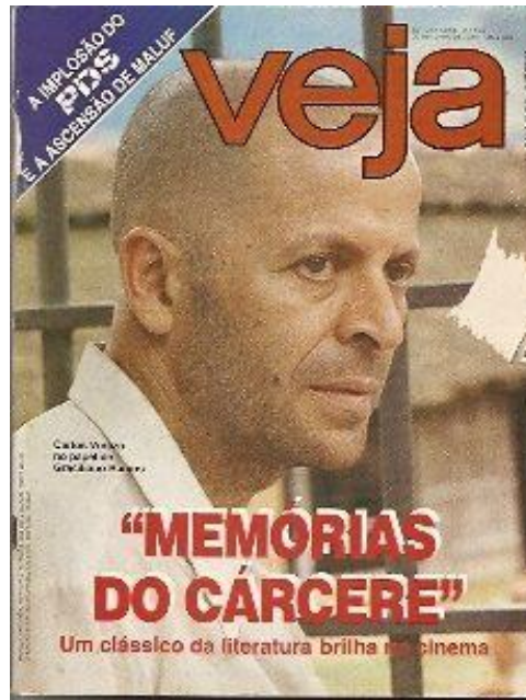
Revista VEJA; Edição 824.