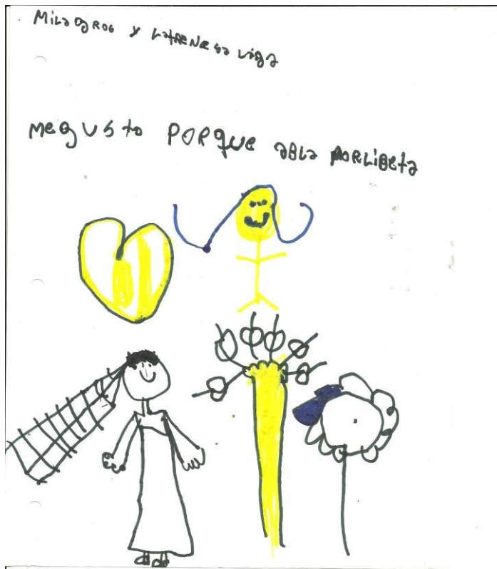
Imagem 29 - Porque fala de liberdade.