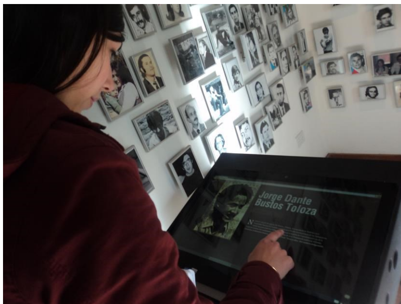
Figura 17 - Fotografia: Lígia Lins, 2013

muitos casos produziram materiais escritos para exposição. A ideia é mostrar aos que visitam o espaço que os que ali foram presos, eram indivíduos como eles, jovens, com ideais, e mais do que tudo humanos, que repetiam de ano na escola, ou que tinham os boletins repleto de notas 10, se apaixonaram, casaram... Tiveram uma vida, que para alguns foi abruptamente interrompida.