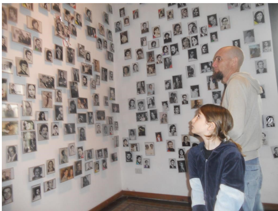
Figura 16, 2013

Essa sala apresenta as histórias dos desaparecidos na cidade de Córdoba durante o último período militar, toda constituição foi feita com o auxílio das famílias, que em