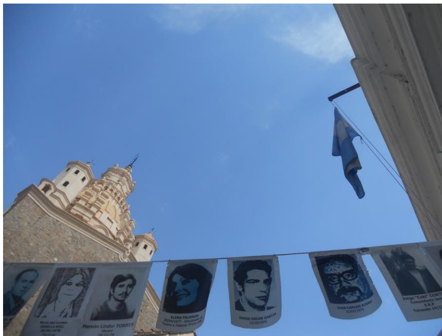
Figura 23 - Fotografia: Lúgia Lins, 2014.

questiona as visitantes sobre o porque de uma frase tão forte em um contexto católico, uma das estudantes lembra a teologia da libertação e partir dessa colocação começa um debate sobre o papel da igreja durante o período militar, em especial naquele centro, pois ele se localiza ao lado da catedral de Córdoba, e da torre se podia ver todo o espaço do pátio.