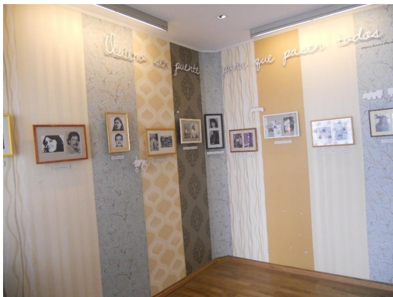
Figura 19

No formato de um quarto de bebê, esse espaço se propõe a lembrar de uma das mais terríveis práticas do terrorismo de Estado, o sequestro e apropriação de bebês. Muitas mulheres grávidas foram presas, e em alguns casos como no EX- ESMA, foram criados zonas exclusivas para que essas jovens fossem levadas, dessem a luz, e imediatamente perdessem contato com seus filhos, em Cordoba não foi diferente, e até hoje muitas avós, já que boa parte das mães nunca foi encontrada, seguem na busca por seus descendentes. Lá estão expostos fotos, e pequenas lembranças, dessa situação traumática.