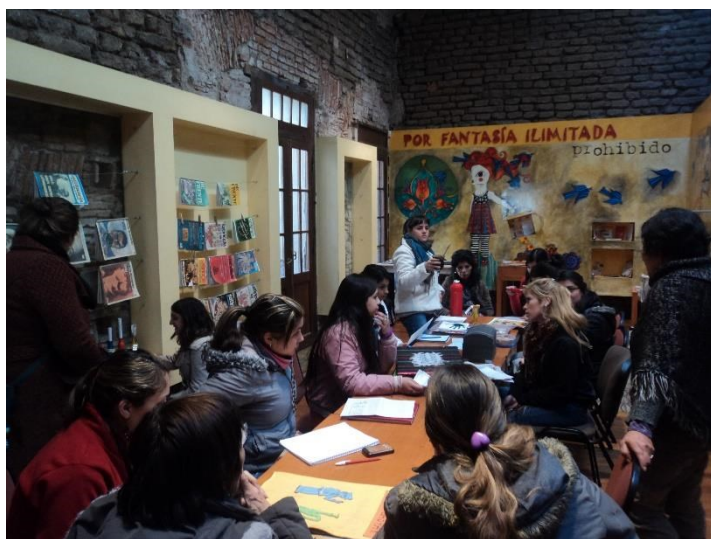
Figura 12 - Fotografia: Lúgia Lins, 2011

A biblioteca é sem dúvida a parte mais emblemática de toda a construção museológica, sua exposição foi alterada algumas vezes de acordo com o contato do público com a mesma.