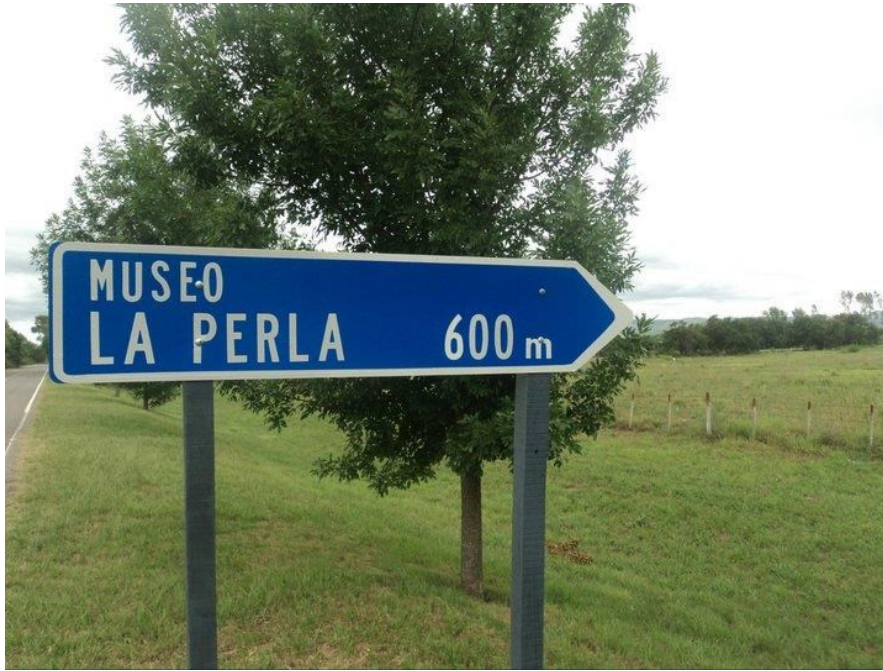
Figura 3: Sinalização do Museu LA PERLA

Se tratava de um campo gigantesco, com alguns galpões que davam a impressão de abandono total. Na época desse primeiro contato, o espaço ainda não havia se articulado para receber muitos visitantes, os poucos que iam, avisavam com antecedência, afinal se tratava de um ex-centro de tortura, que ficava a duas horas da cidade, não é exatamente um roteiro turístico.