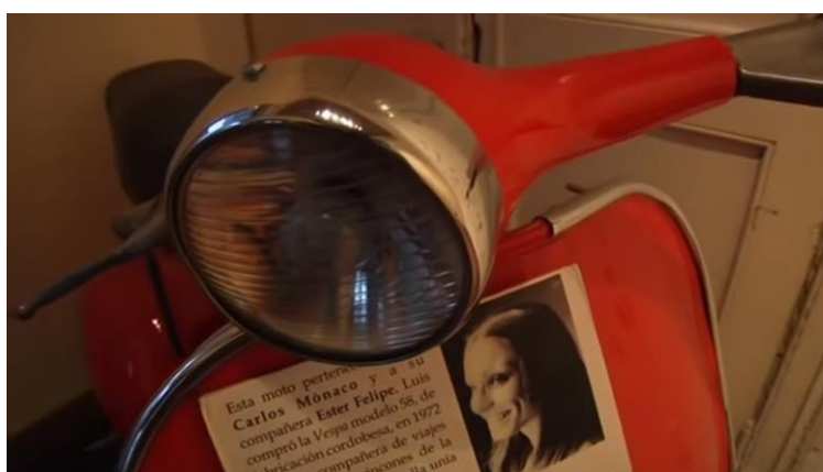
Figura 18 - Fotografia: Lígia Lins, 2013

Ainda na proposta de humanizar os indivíduos que passaram por ali, estão expostos desde vestidos de 15 anos, até livros, e uma motocicleta que pertenceu a um jovem casal.