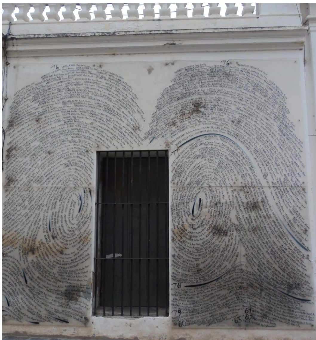
Figura 1 Digitais construídas com os nomes dos desaparecidos de Córdoba.