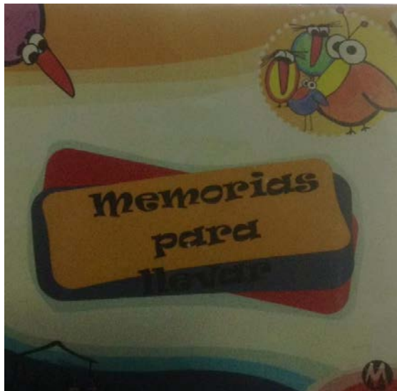
Figura 14 2-

Ainda sobre os contos proibidos, são produzidos diversos materiais com as questões levantadas na visita. O livreto memórias para levar , é um bom exemplo, nele se pede a criança que analise a própria memória, o que gosta de fazer, brinquedos favoritos, qual foi a história que mais gostou das que lhe foram narradas no museu, e trás um novo conto, ainda desconhecido, na última parte há ainda espaço para desenhos livres, e se deixa a pergunta... “Quem você traria para visitar o arquivo?”.