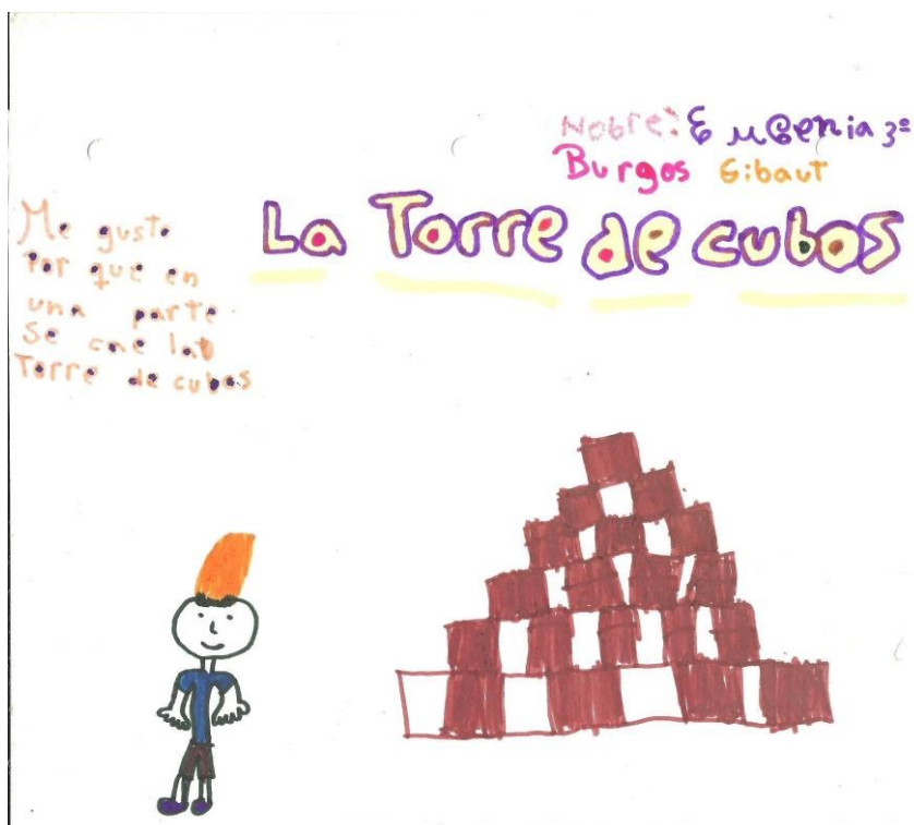
Imagem 26 - Gostei porque tem uma parte em que os cubos caem. Eugenia