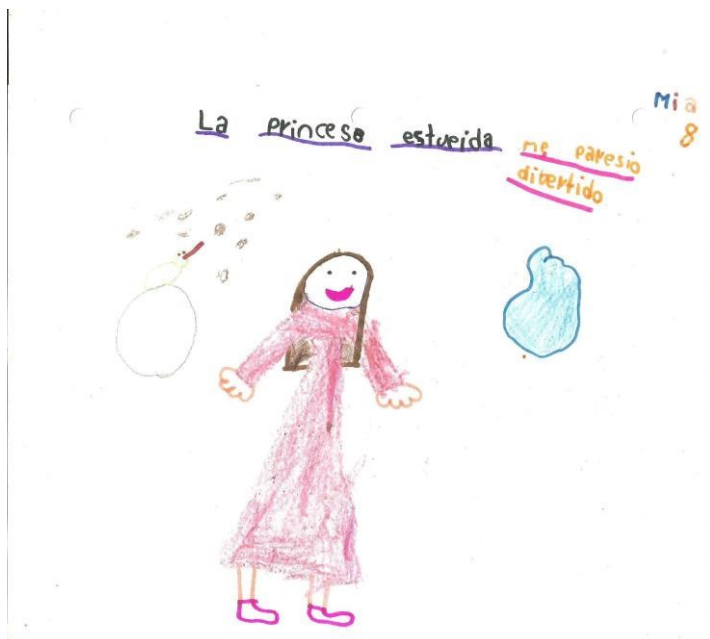
Imagem 25 - Pareceu divertido. Mia 8 anos