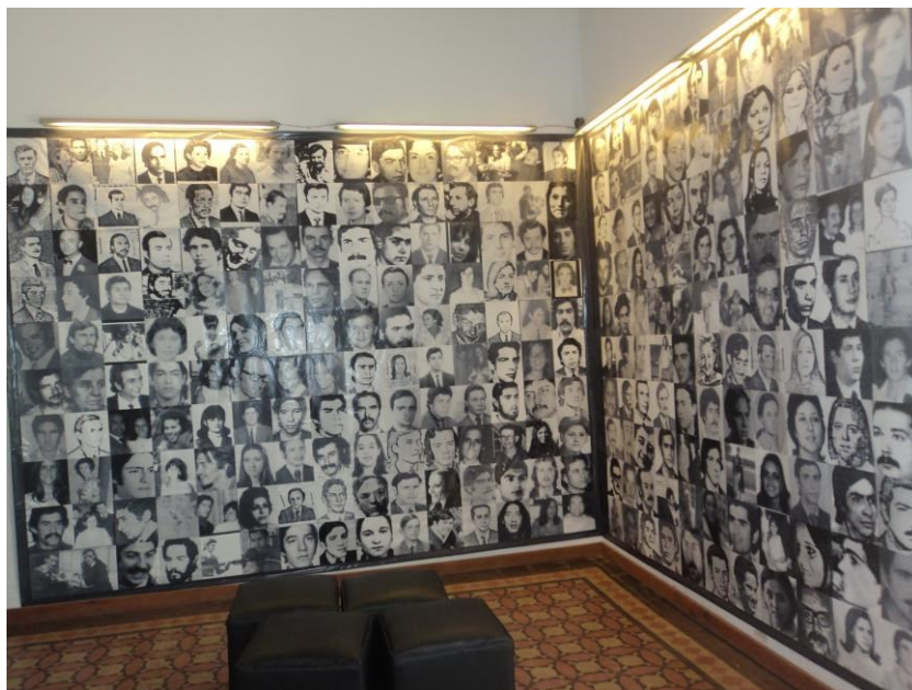
Figura 15 - Fotografia: Lígia Lins, 2013