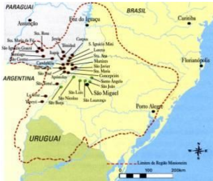
Figura 4 – Site do Centro de referencia virtual do professor, acessado em 20 de fevereiro de 2014.

Tordesilhas, assinado entre Espanha e Portugal. Esse traçado é bem diferente do que entendemos hoje enquanto referência do território colonizado pelos dois países, dessa forma a região das Missões não constituía parte do terreno português, e sim da Coroa espanhola.