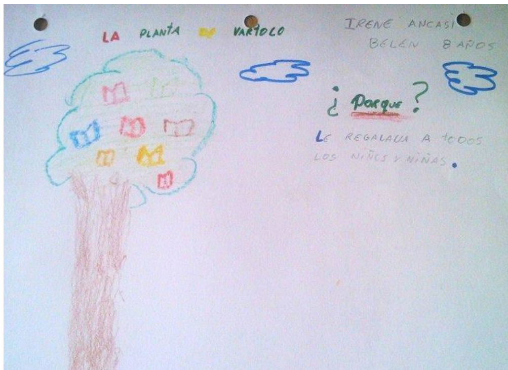
Imagem 30 - A Planta de Bartolo, porque ele distribui (livros) a todos os meninos e meninas. (Irene 8 anos)