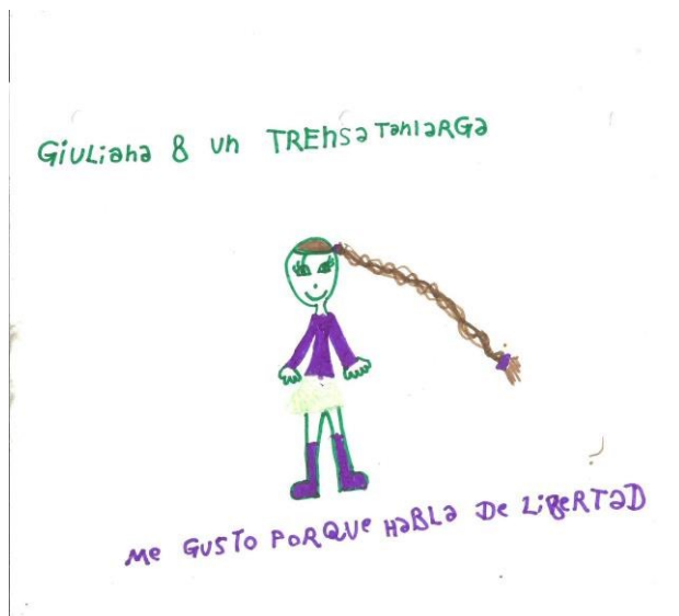
Imagem 27 - Gostei porque fala de liberdade. Giuliana 8 anos