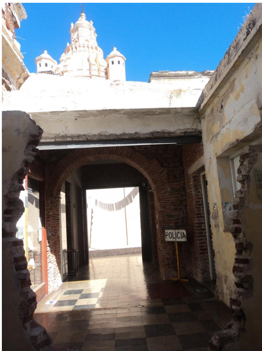
Figura 2: Torre da igreja vista de dentro do museu, com destaque para o que sobrou do muro feito após a ditadura. Fotografia: Lígia Lins, 2013.

Não por acaso a associação a outro período da História contemporânea acaba sendo inevitável, compondo assim novas problemáticas. Da mesma forma que o Holocausto se tornou o símbolo máximo do fracasso da proposta de progresso do século XX, totalizando e generalizando situações específicas, pode também se acompanhado de uma proposta crítica, figurar como uma forma de linguagem universal capaz de criar um poderoso prisma pelo qual se pode olhar outros exemplos de violência em massa. (HUYSSSEN, 2004, p.13)