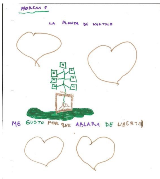
Imagem 28 - A Planta de Bartolo, porque fala de liberdade. Morena, 7 anos