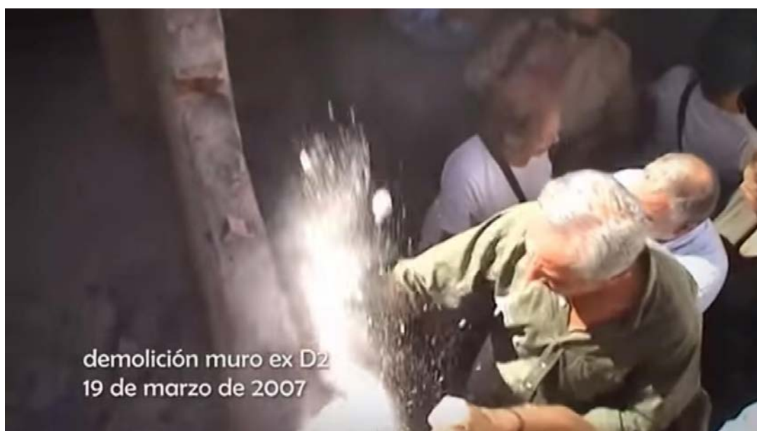
Figura 20 - Vídeo institucional arquivo de la memoria de cordoba

Além das salas relatadas, existem ainda algumas exposições itinerantes, com temáticas voltadas aos direitos humanos, duas celas que de original mantem apenas a fachada da entrada, e os dois pátios, o da frente em que está localizado o muro construído após o regime, no intuito de esconder o local, e o de trás onde se realizam atividades quando o público é maior.